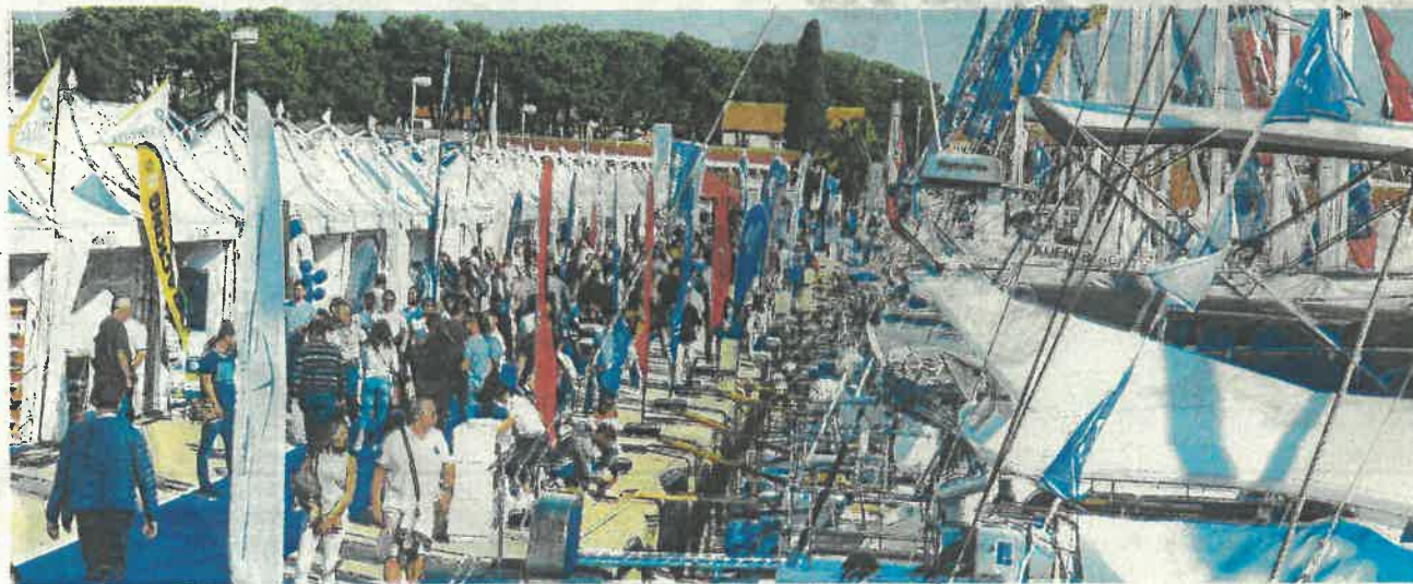
Biograd Boat Show danas otvara svoja vrata posjetiteljima u svojem 24. izdanju

Posebne uvjete i organizaciju Croatia Charter Expo omogućili su velikodušnom potporom Grad Biograd, Hrvatska turistička zajednica i Hrvatska gospodarska komora.