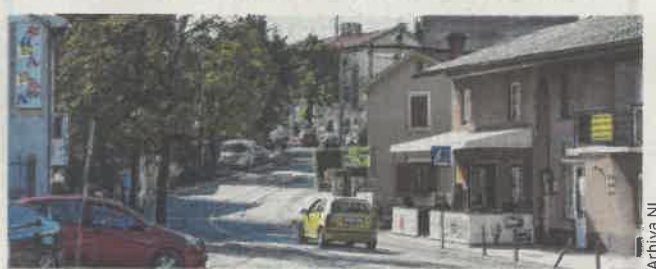
Odluka je u skladu s općinskim Statutom i Pravilnikom

Odlukom načelnice Općine Viškovo Sanje Udović Udruženje umirovljenika Viškovo dobit će 44 tisuće kuna za tri programa u 2021. godini: 15 tisuća kuna za program medicinskih vježbi za sprečavanje osteoporoze, 15 tisuća kuna za projekt »I mi se volimo družiti« te 14 tisuća