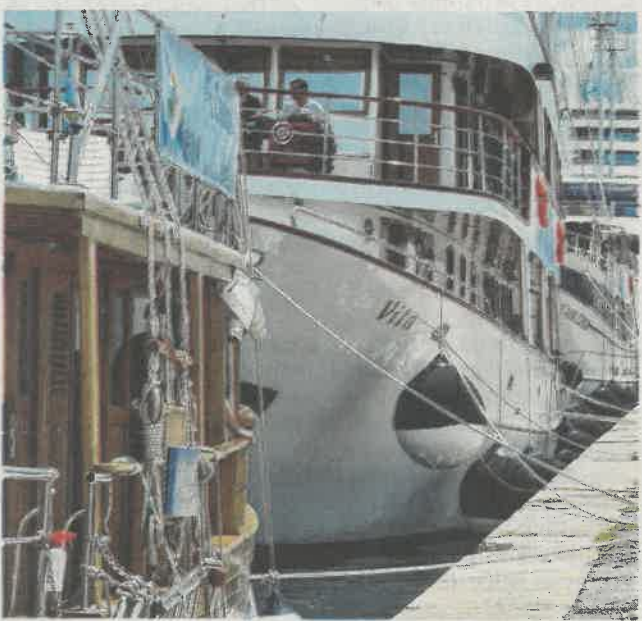
Posljednje ovogodišnje polaske ID Rivini brodovi imali čak i bolje nego u prijevremenim godinama

Što se tiče prihvata brodova za kružna putovanja s većim kapacitetima putnika, odnosno velikih kruzera, prema podacima Lučke uprave Rijeka u 2019. godini u Rijeku je stiglo oko 31.500 putnika s velikih kruzera, a najave za 2020. predviđale su i dvostruko više dolazaka s obzirom na najave od čak 40 brodova na kružnim putovanjima. Kao posljedica globalne krize uzrokovane pandemijom, lani su svi dolasci brodova otkazani, kao i u prvih devet mjeseci ove godine. Prvi dolazak velikog broda »Eurodam« s 903 putnika, kompanije Holland America Line, zabilježen je 3. listopada, dakle, krajem turističke sezone.