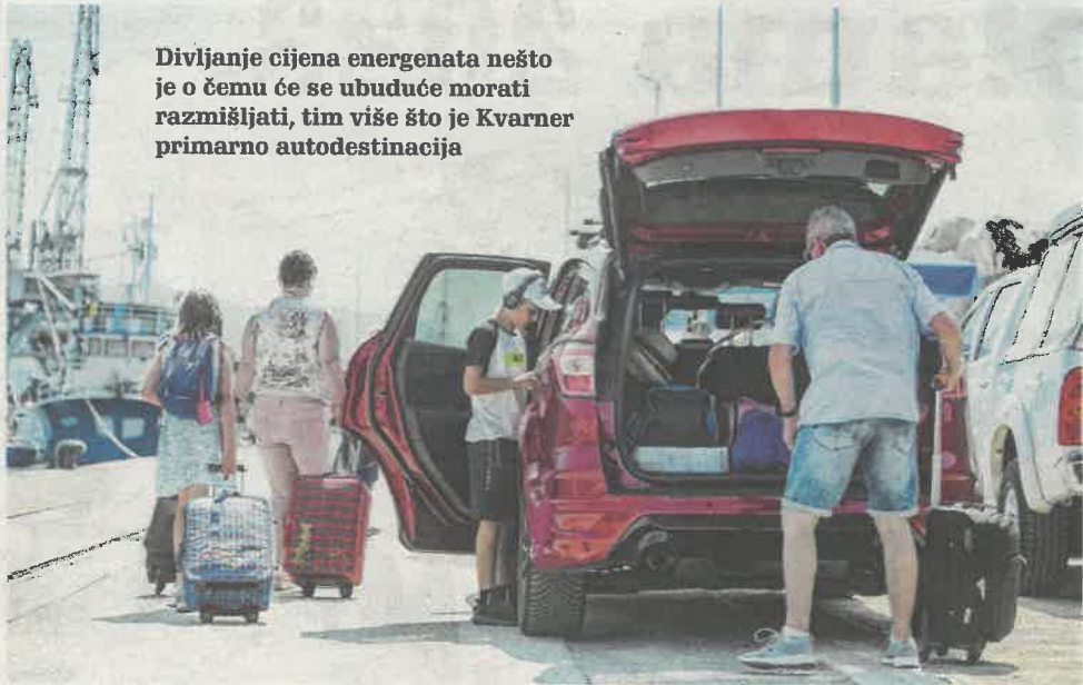
Divljanje cijena energenata nešto je o čemu će se ubuduće morati razmišljati, tim više što je Kvarner primarno autodestinacija

građevinsku dozvolu izdanu od Upravnog odjela za prostorno uređenje, graditeljstvo i zaštitu okoliša PGŽ-a. Zahvat obuhvaća izgradnju ogranka ukupne dužine 264 metra. Radove će izvoditi Građevinar iz Čabra, a nadzirati tvrtka House iz Rijeke. (S. K.)