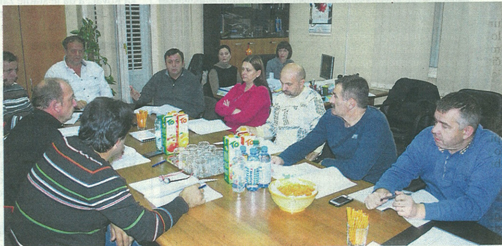
Vijećnici Dobrinja donijeli su dugoročno važnu odluku

Odabrani lokalitet, naglasio je Dobrila, rasprostire se na oko 7.000 kvadrata blago uzdignutog zemljišta u pretežito privatnom vlasništvu, a uz to