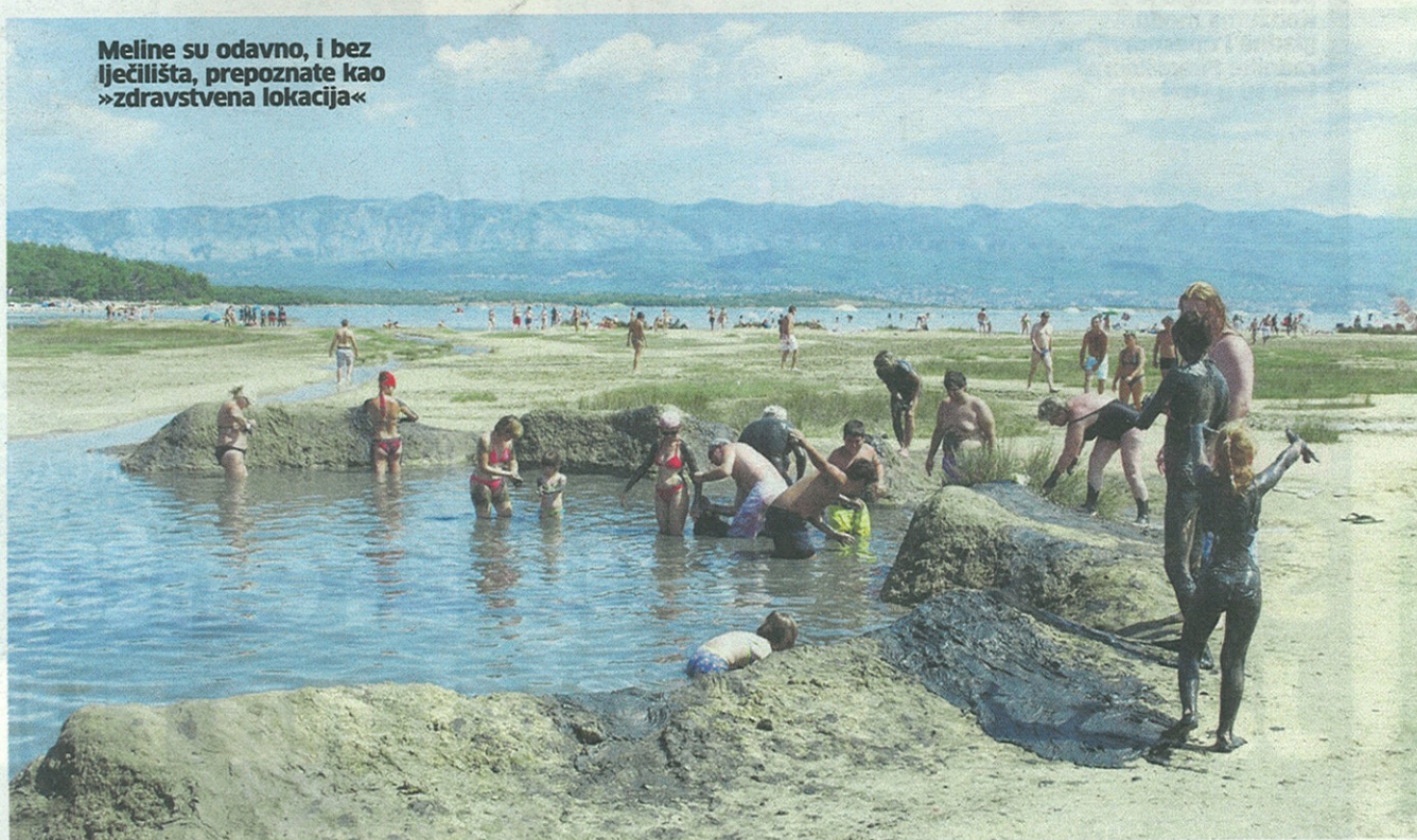
Meline su odavno, i bez lječilišta, prepoznate kao »zdravstvena lokacija«