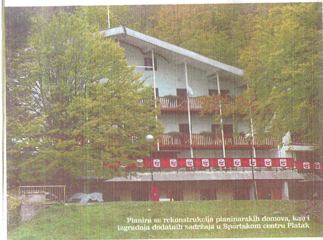
Planira se rekonstrukcija planinarskih domova, kao i izgradnja dodatnih sadržaja u Sportskom centru Platak

plana iz Artheo d.o.o. Zagreb, za sada je planirano povećanje od dvadesetak parkirnih mjesta. Mirko Vukelić (SDP) kazao je kako je nužno da se groblje ogradi, što će se, prema riječima načelnice Cvitan Polić, svakako i učiniti, dok je Edo Žeželić (HSL) istaknuo problem s postojećim zelenilom, točnije stablima borova, koji imaju plitko korijenje te bi, po njegovom mišljenju, trebalo posaditi neka druga stabla otpornija na vremenske neprilike, posebice buru, s obzirom na to da su borovi već nanijeli velike štete grobnicama na groblju u Gradu Grobniku.