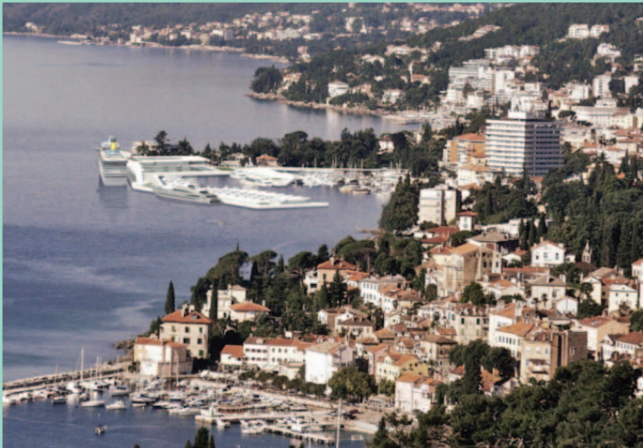
Slika 2. Prikaz proširenja luke Opatija